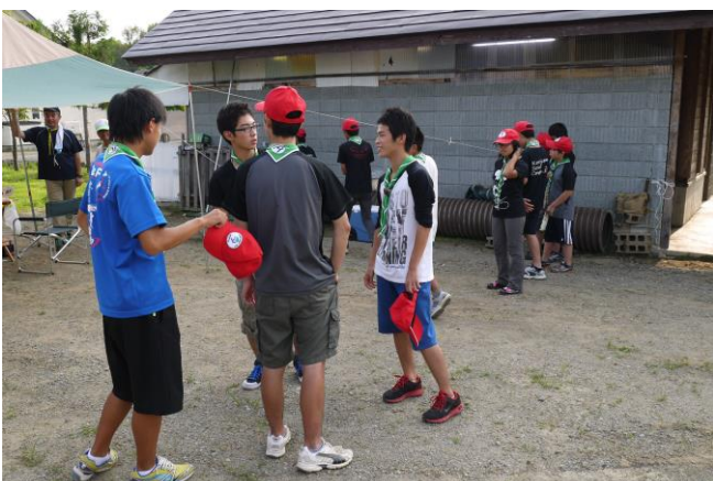
近くで団キャンプ中だった郡山2団さん、お邪魔しました。