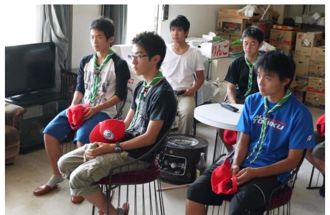
小野川荘に戻り、次年度の年プロについて話し合い…