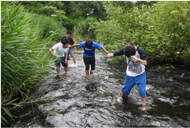
歩きにくそうだったけど、どうしたの？ サンダル装備しないと～