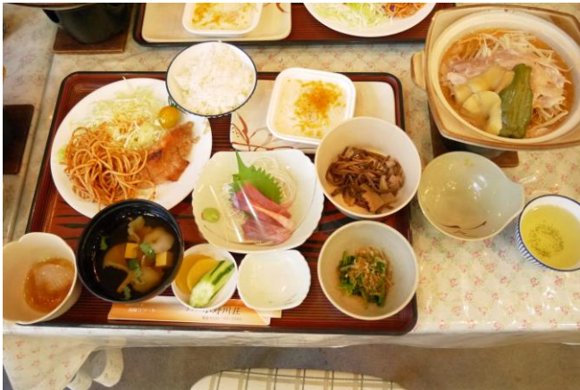
2日目の夕食。 どの食事でも豪勢でしたね。