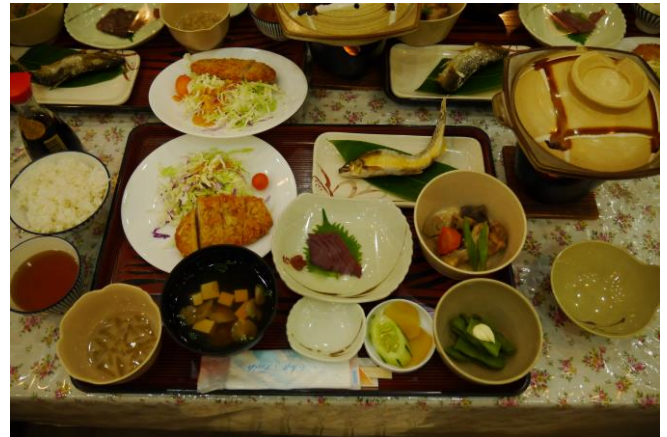
到着後すぐに夕食でした。