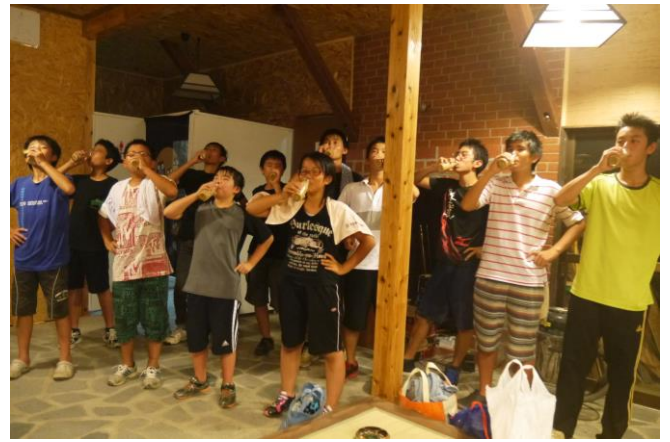
夕食の後は露天風呂！ …の後に恒例のコレ。