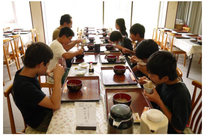
食す！！ 美味しかったけれど、多かったね…