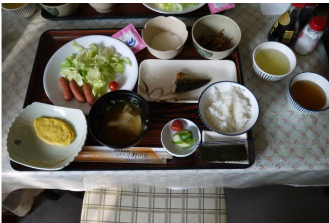
3日目の朝食。 なんだか今回は食事関係ばかりですが…