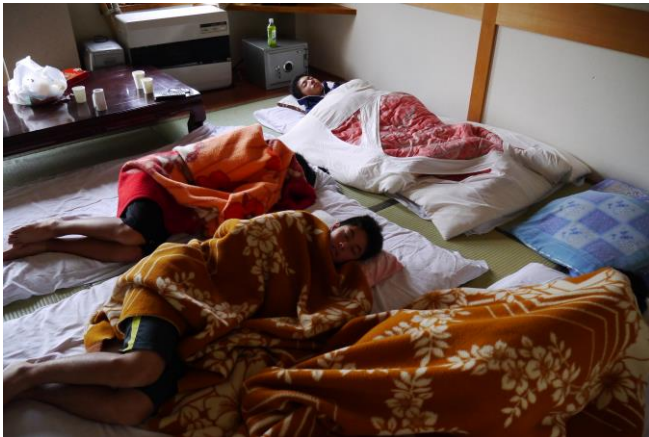
こちら上級生組の部屋。 ちゃんと布団を使っていますが……→