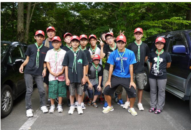
昼食に蕎麦を腹一杯食べた後は、五色沼でハイキング。