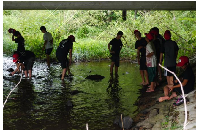
魚もたくさんいましたね。 蚊もたくさんいたけれど…