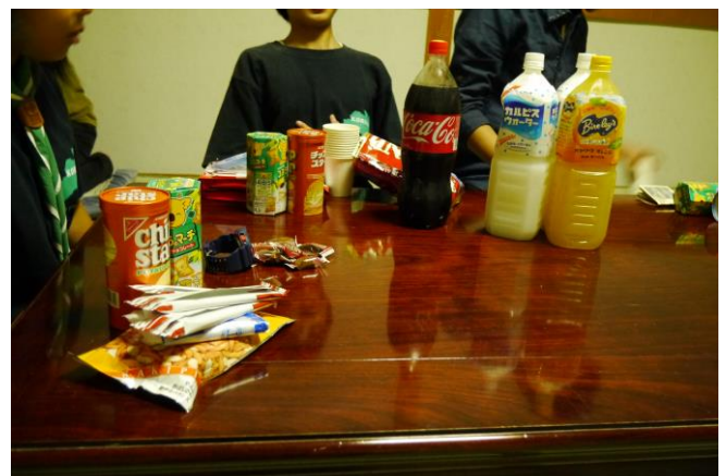
部屋長会議。 お菓子第一弾！