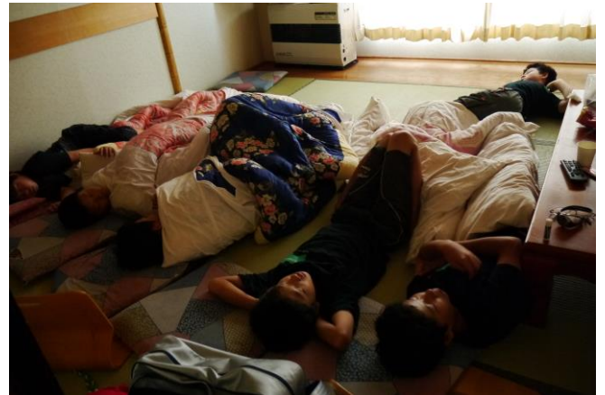
こちら下級生組の部屋。 …ワイルドだろう？