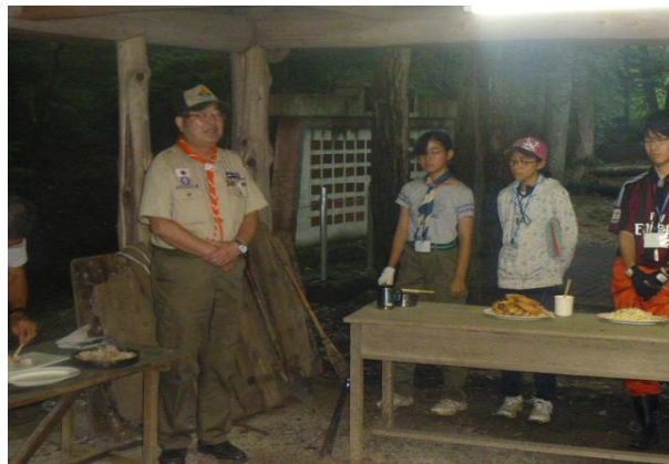
理事長も参加して「斥候の宴」