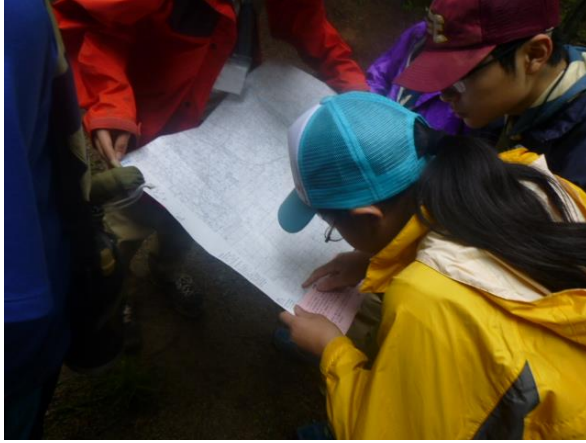
座標を地図に記入