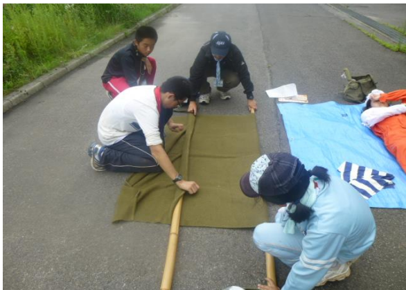
怪我人の手当をし、救急搬送の訓練