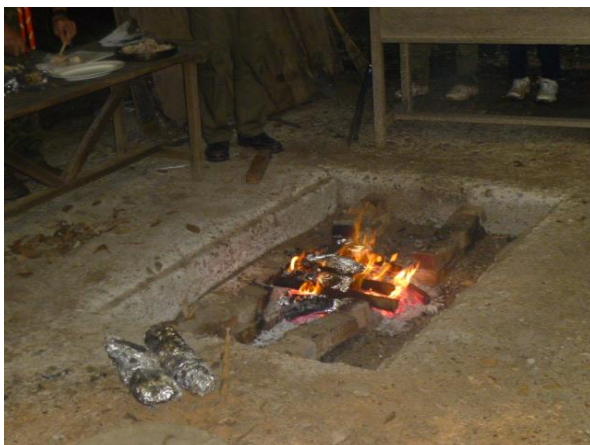
赤城隊長の18番「豚パイ包み焼き」