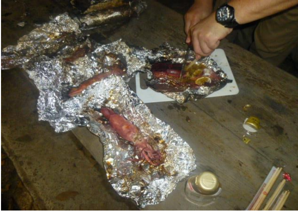
イカのホイル焼き